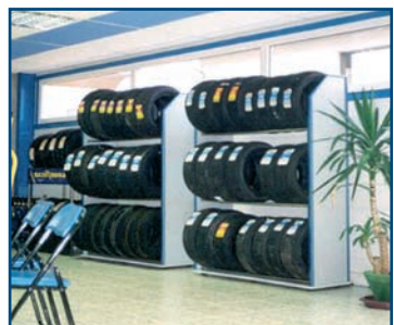
Opslag op lange termijn