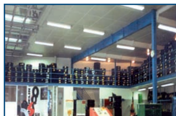
Opslag op korte termijn

* levensduur = kilometerrendement. ** ouderdom = leeftijd.