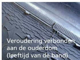
Veroudering verbonden aan de ouderdom (leeftijd van de band)