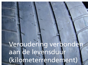
Veroudering verbonden aan de levensduur (kilometerrendement)